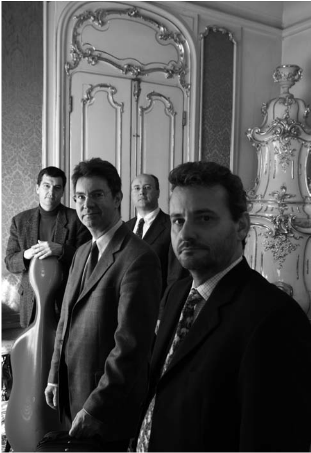
Quatuor Artis