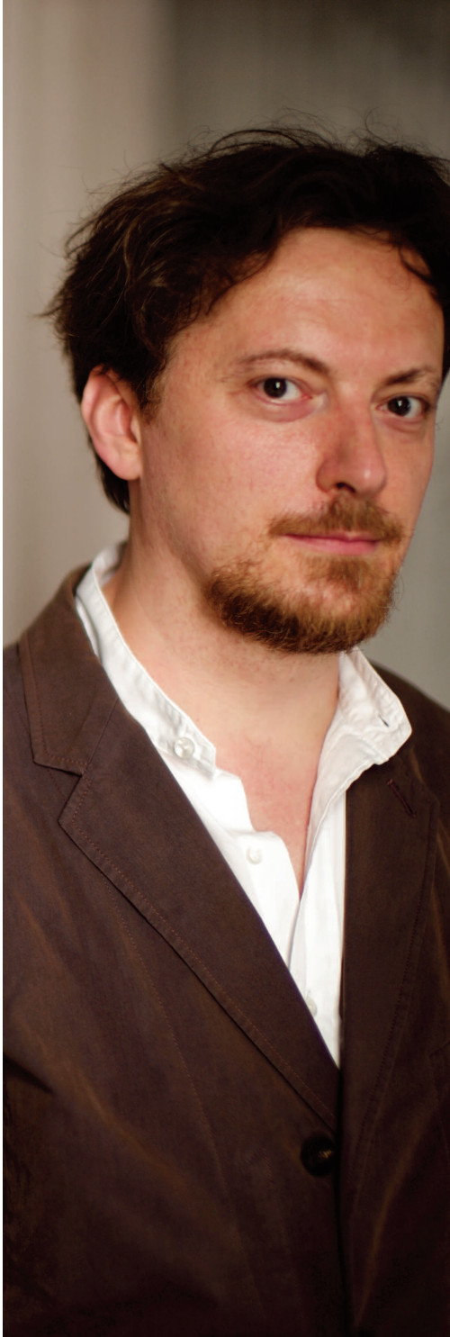
Georg Nigl

Les master classes proposées par l'Opéra de Lille en partenariat avec le Club Lyrique Régional , sont organisées depuis plusieurs années afin d'enrichir en région l'offre de formation continue dans le domaine du chant lyrique.