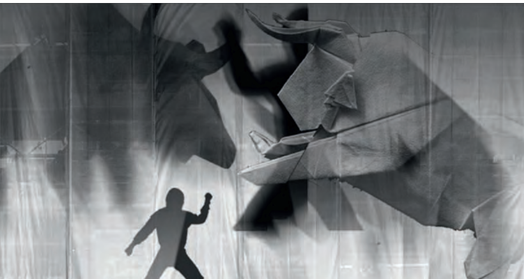
Maquette du Monstre du Labyrinthe .

En Crète, Minos et son peuple accueillent les adolescents qu'ils précipitent dans le labyrinthe. Alors qu'ils tentent de s'orienter, Thésée et les jeunes Athéniens rencontrent Dédale, concepteur du labyrinthe que Minos a enfermé ici, et qui parvient toujours à échapper au Minotaure grâce à sa connaissance de cette prison qu'il a lui-même inventée. D'abord incrédule, Dédale finit par accepter de conduire Thésée au cœur du labyrinthe pour qu'il affronte le Minotaure. On entend le monstre s'approcher, et après un rude combat, Thésée finit par triompher. Dédale guide les vainqueurs hors du labyrinthe. À Athènes, les habitants de la cité aperçoivent une voile au loin et ne tardent pas à reconnaître le bateau de Thésée et de leurs enfants. Tous reviennent sains et saufs. Les voix de Thésée, de sa mère, de Dédale et de tous les Athéniens, petits et grands, s'unissent pour louer la bravoure de Thésée et le retour de la lumière.