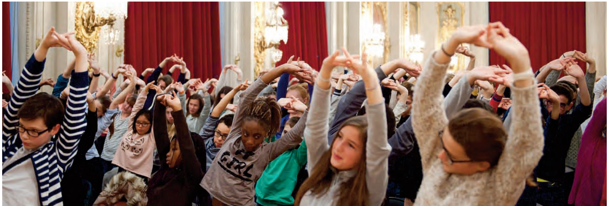
Répétitions du Monstre du Labyrinthe , Opéra de Lille, mai 2016.