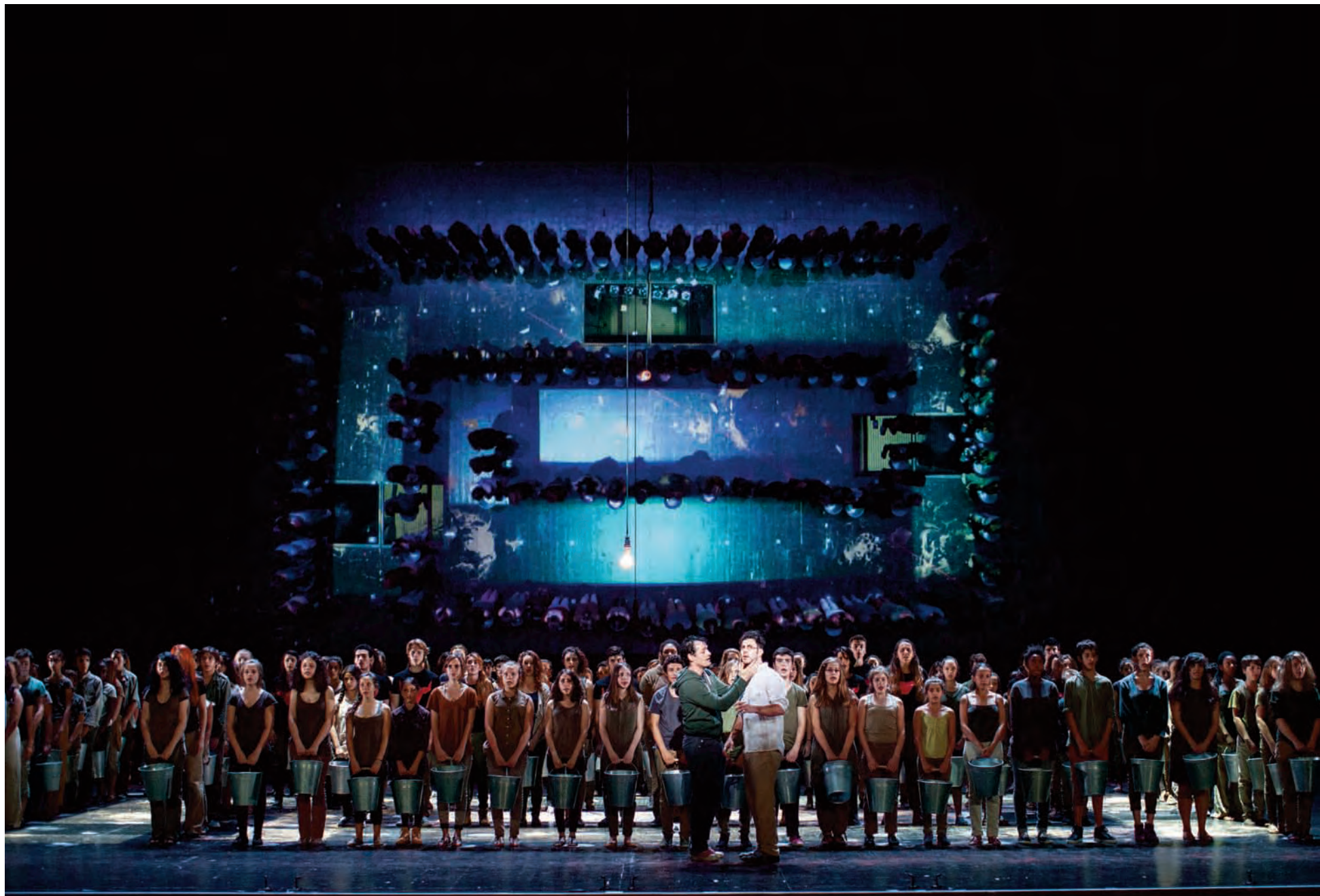
Le Monstre du Labyrinthe , Festival d'Aix-en-Provence, Juillet 2015