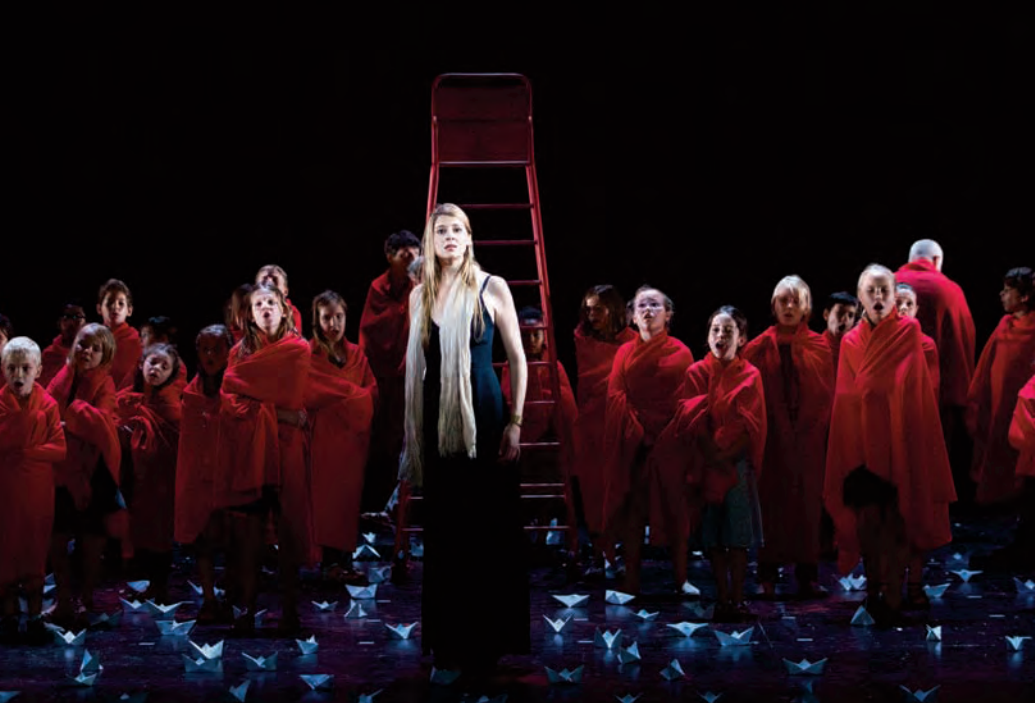
Le Monstre du Labyrinthe , Festival d'Aix-en-Provence, Juillet 2015.