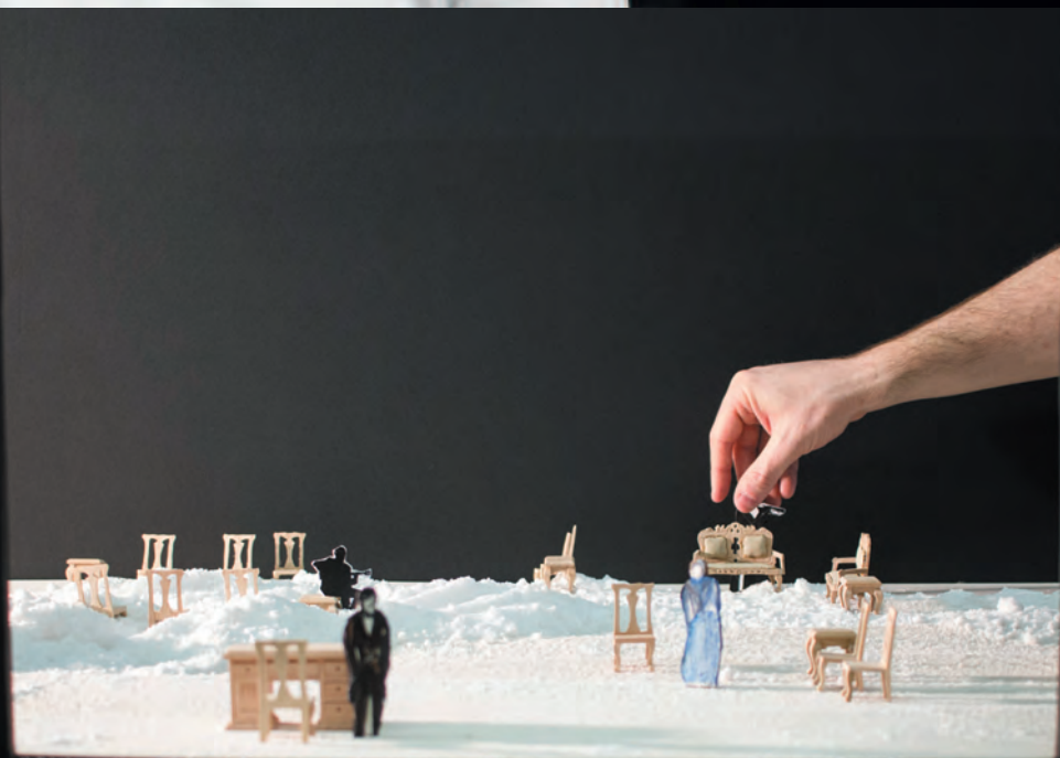
Le Premier Meurtre, maquette ©Jb Peter Cagny, Opéra de Lille