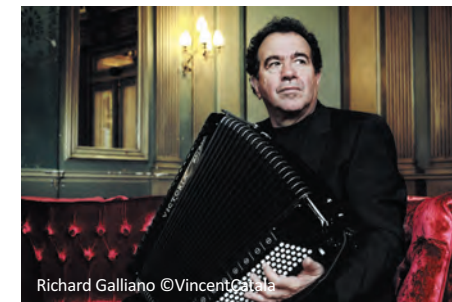
Richard Galliano

le phénix pôle européen de création scène nationale Valenciennes