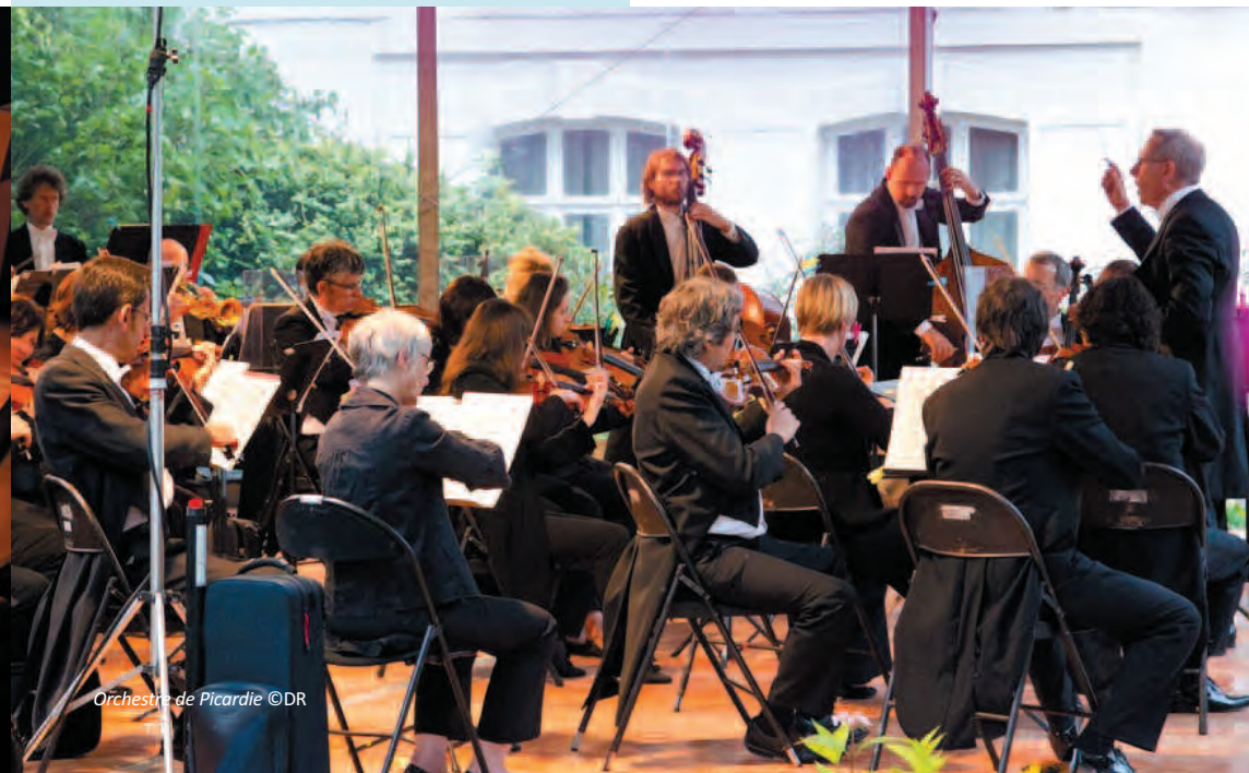
Orchestre de Picardie