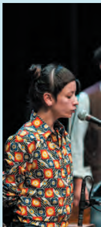
Moondog ©Christian Mathieu