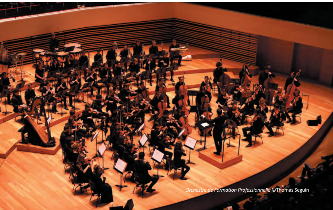
Orchestre de Formation Professionnelle