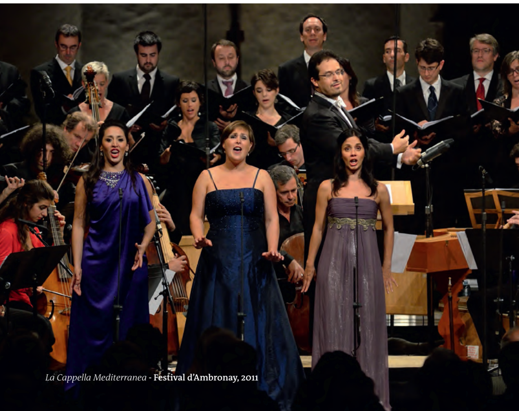
La Cappella Mediterranea - Festival d'Ambronay, 2011