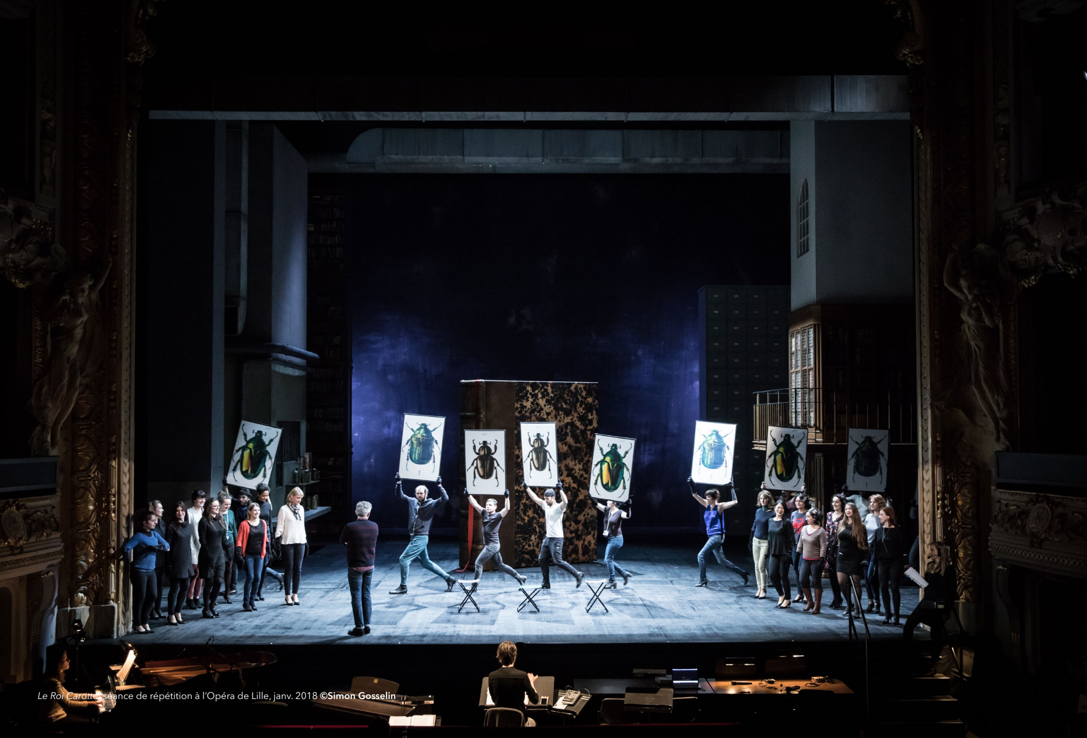
Le Roi Carotte, séance de répétition à l'Opéra de Lille, janv. 2018