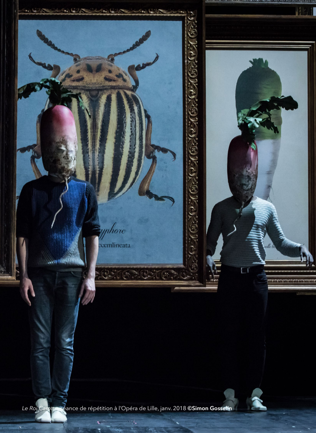
Le Roi Carotte, séance de répétition à l'Opéra de Lille, janv. 2018