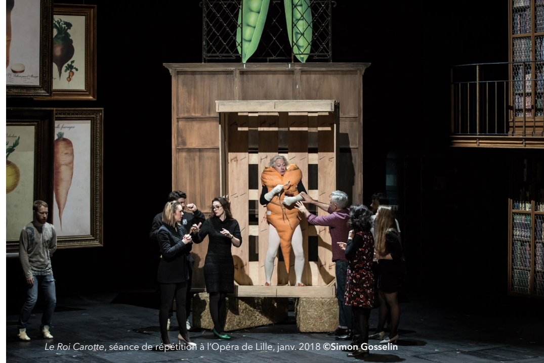
Le Roi Carotte, séance de répétition à l'Opéra de Lille, janv. 2018

Si Le Roi Carotte est une rareté, c'est d'abord parce qu'il a été conçu avec des moyens absolument phénoménaux. Une sorte de super production hollywoodienne avant l'heure ! Le Hollywood de la grande époque, en tout cas. C'est un véritable opéra féérique. Il demande beaucoup de moyens humains – il y a notamment une énorme distribution de chanteurs, le chœur, les comédiens etc. –, mais aussi en matière de décors, costumes, machinerie. C'était difficile à monter à l'époque, et ça l'est encore aujourd'hui ! C'est ce qui explique qu'on ne se soit pas bousculé pour le remonter... Offenbach avait déjà lui-même proposé une version raccourcie, car l'originale durait près de six heures, avec deux entractes ! Il faut vraiment un duo comme Laurent Pelly et Agathe Mélinand, pour trouver une dramaturgie qui rende l'ouvrage accessible au public d'aujourd'hui. Ils ont fait un travail absolument remarquable pour redimensionner l'œuvre et lui donner une cohérence. Je crois que le caractère même de grande féerie de cet ouvrage demande des moyens que l'on peut difficilement trouver dans bien des théâtres. Si l'on prend le livret au pied de la lettre, cela semble presque impossible à monter. Tous ces changements de décors, la profusion de personnages... On dirait qu'Offenbach a