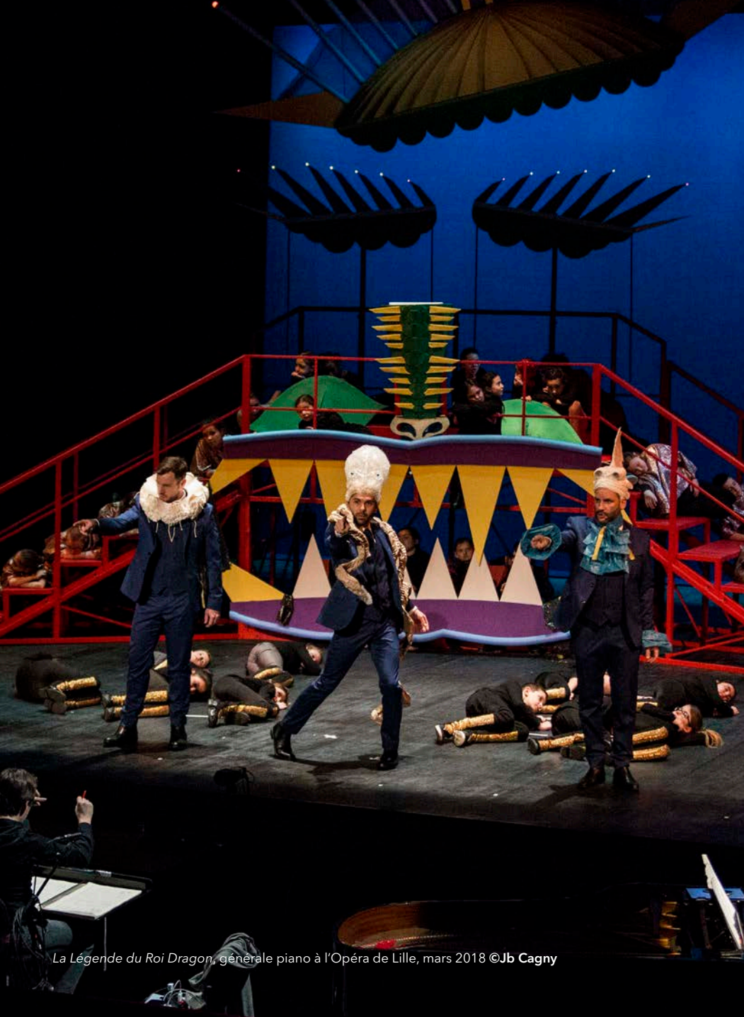
La Légende du Roi Dragon, générale piano à l'Opéra de Lille, mars 2018