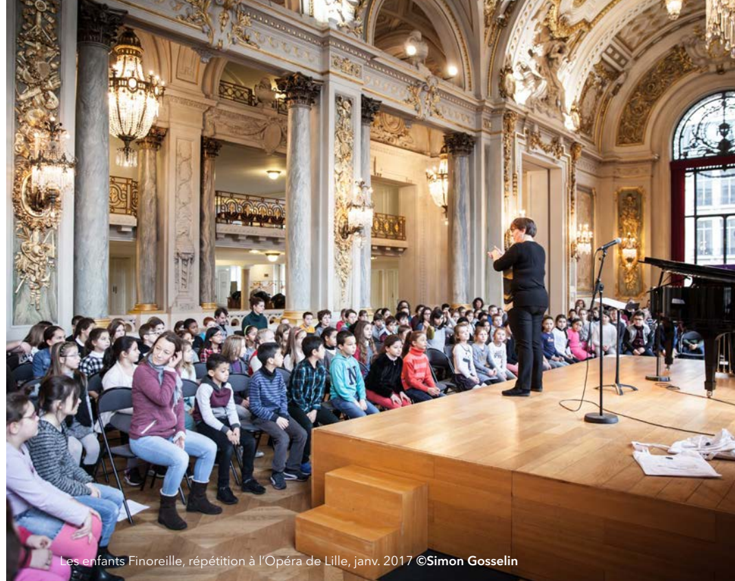
Les enfants Finoreille, répétition à l'Opéra de Lille, janv. 2017

Finoreille est un projet financé par le Ministère de la Culture (Drac Hauts-de-France), la Direction Régionale Jeunesse et Sports et de la Cohésion Sociale, le Plan Musique-Ville de Lille et le 9-9bis de Oignies.