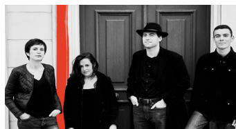
Musique du monde (Tango)

Tranes et transgressions avec le Spiritango Quartet Mercredi 24 octobre à 18h