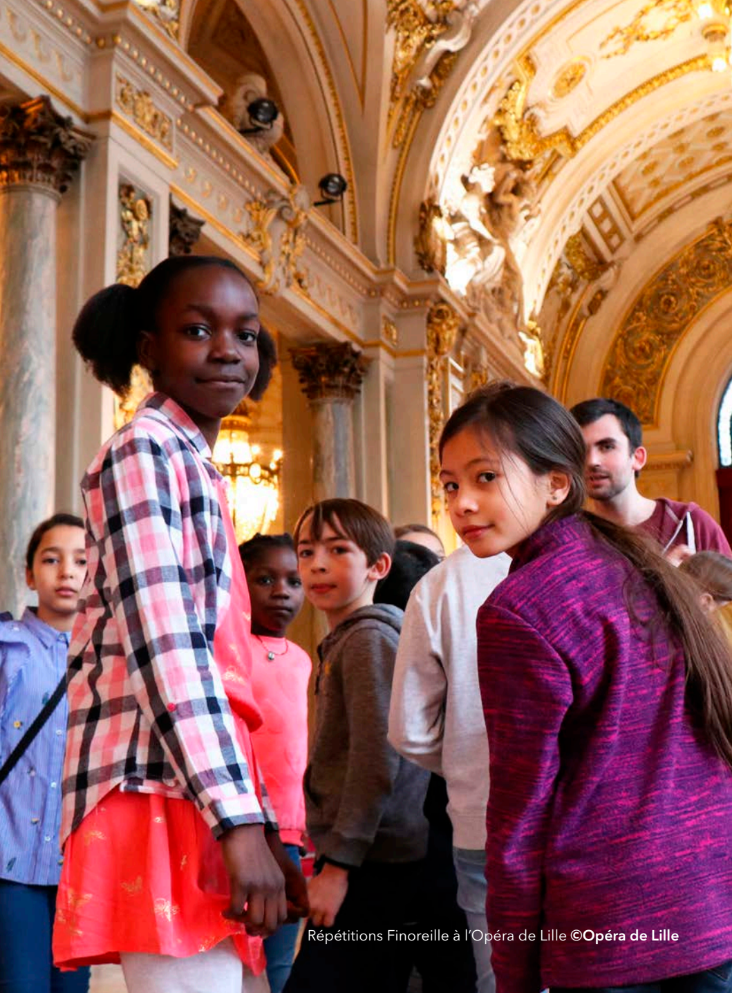
Répétitions Finoreille à l'Opéra de Lille