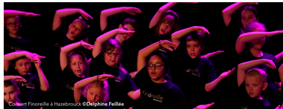
Concert Finoreille à Hazebrouck

Les enfants des ateliers Finoreille de Lille-Sud et Vauban, Marcq-en-Barœul et Mons-en-Barœul vous entraînent dans un tour du monde chanté, de l'Irlande au Brésil en passant par l'Égypte, accompagnés au piano, au cajon... et aux percussions corporelles !