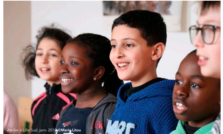
Atelier à Lille Sud, janv. 2019