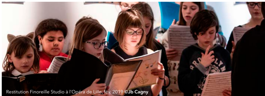
Restitution Finoreille Studio à l'Opéra de Lille, fév. 2019