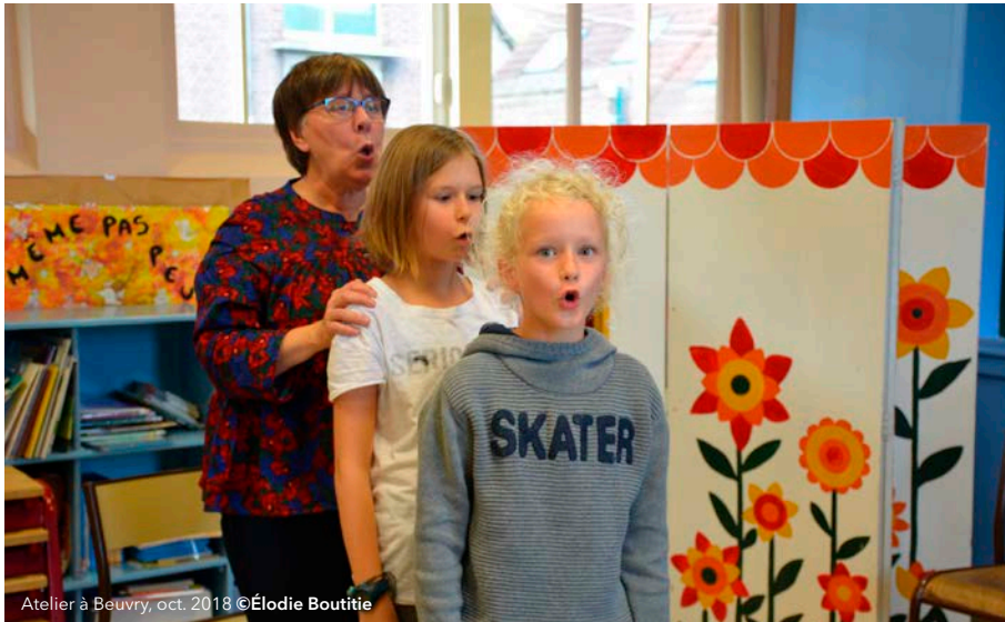
Atelier à Beuvry, oct. 2018