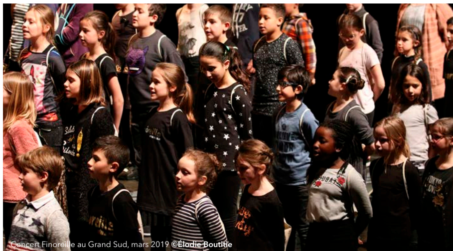
Concert Finoreille au Grand Sud, mars 2019