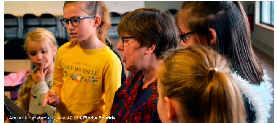
Atelier à Hazebrouck, janv. 2019