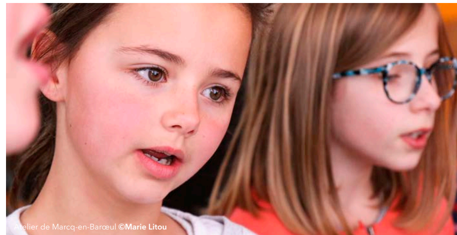
Atelier de Marcq-en-Barœul

Avec un programme dédié aux comédies musicales, Finoreille Studio vous embarque pour un swing musical et de la poésie ! Redécouvrez les grands classiques interprétés par nos jeunes chanteurs.