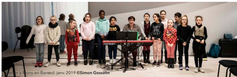
Atelier à Mons-en-Barœul, janv. 2019