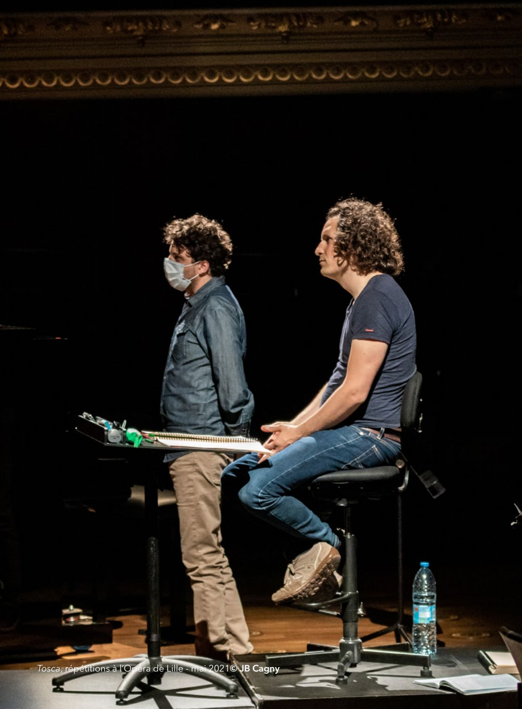
Tosca, répétitions à l'Opéra de Lille - mai 2021