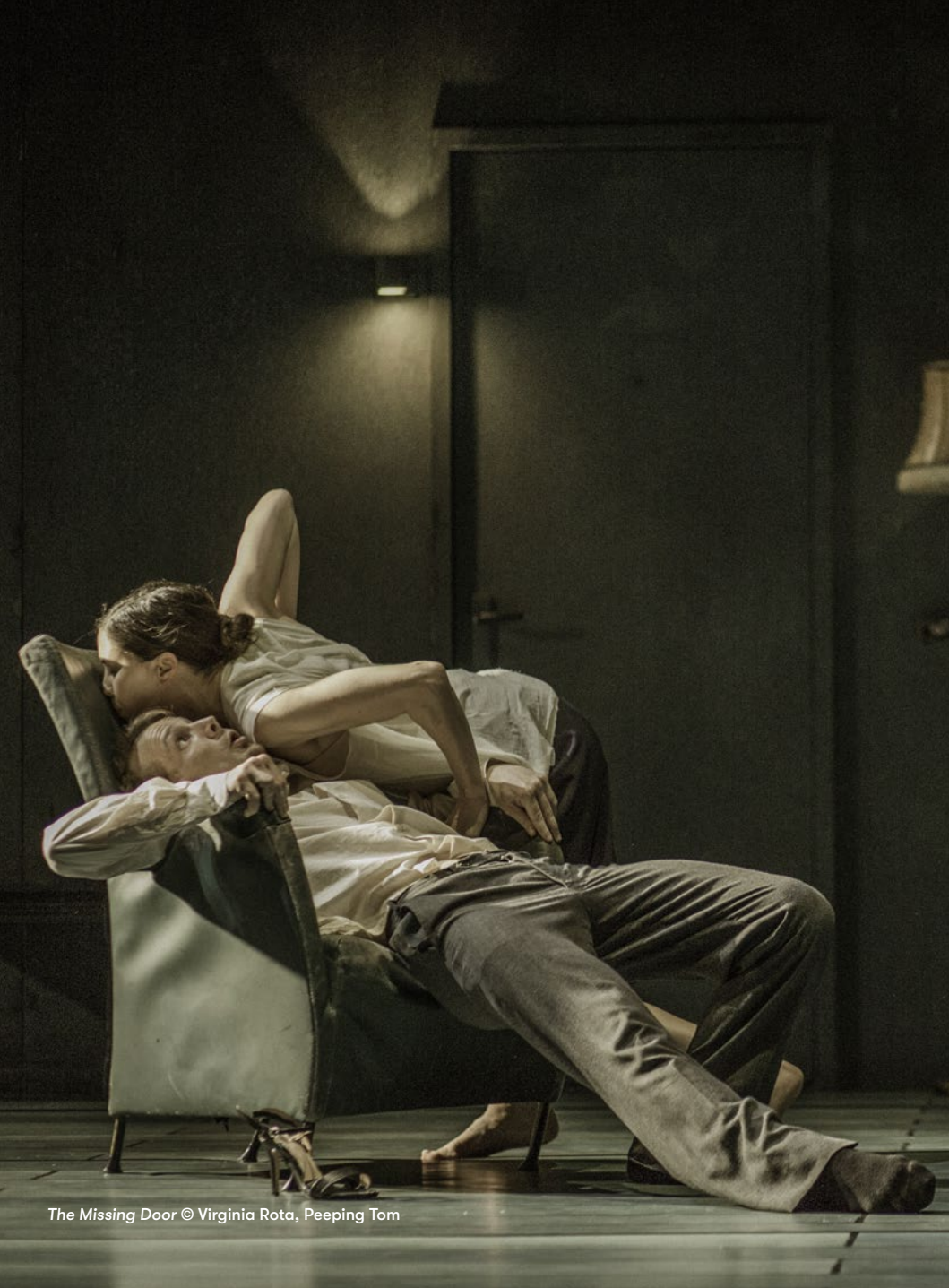
The Missing Door © Virginia Rota, Peeping Tom