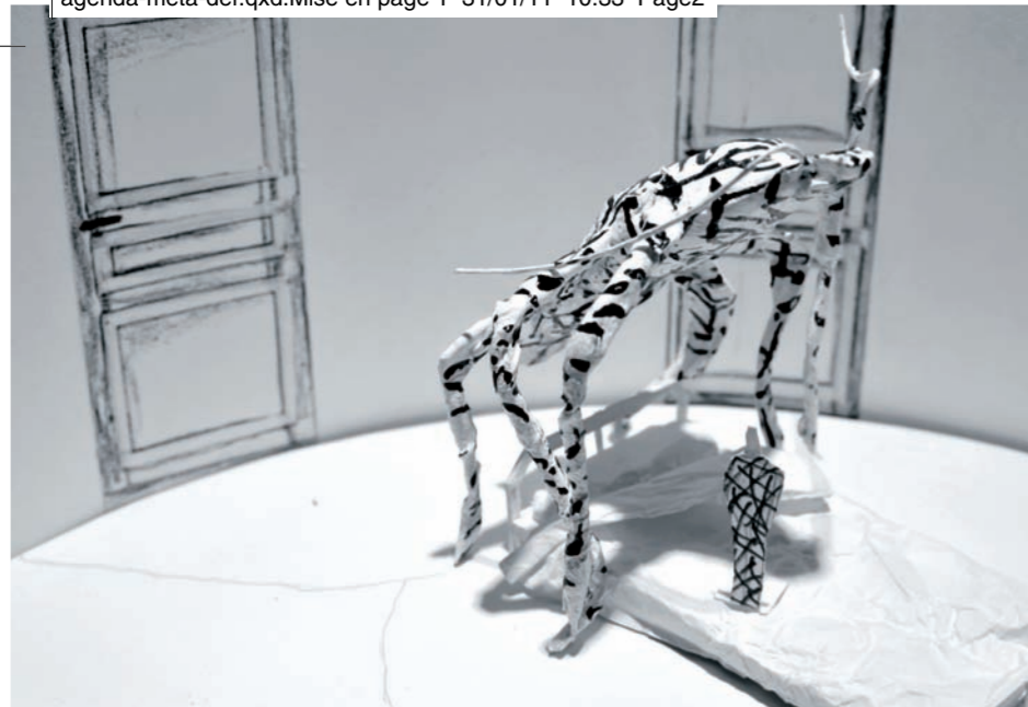
La Métamorphose, maquette de décor d'Emmanuel Clolus janvier 2011