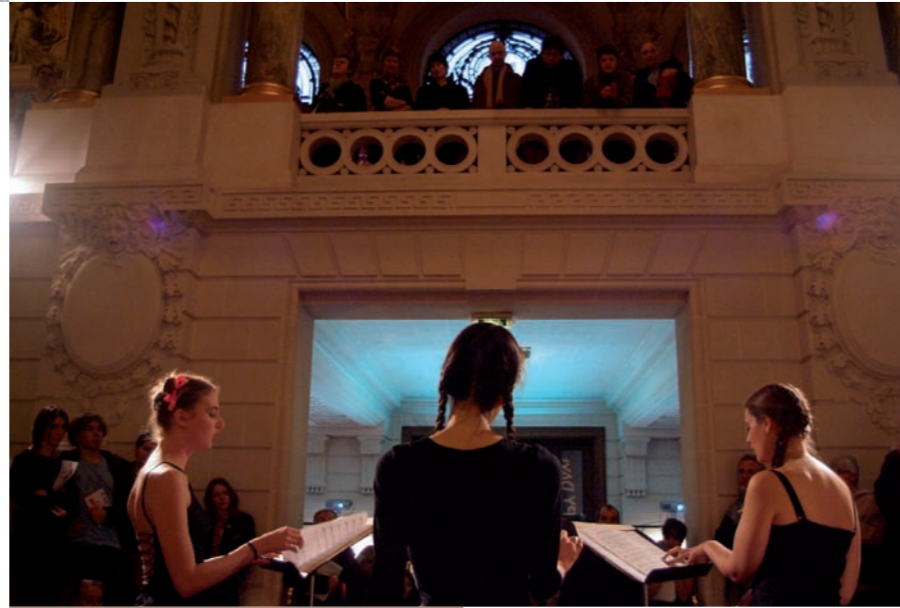
Happy Day à l'Opéra de Lille novembre 2010