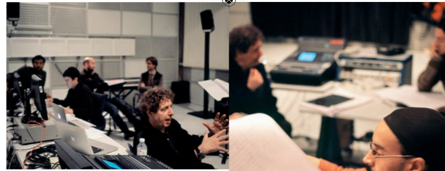
La Métamorphose - séance de répétition à l'Ircam décembre 2010