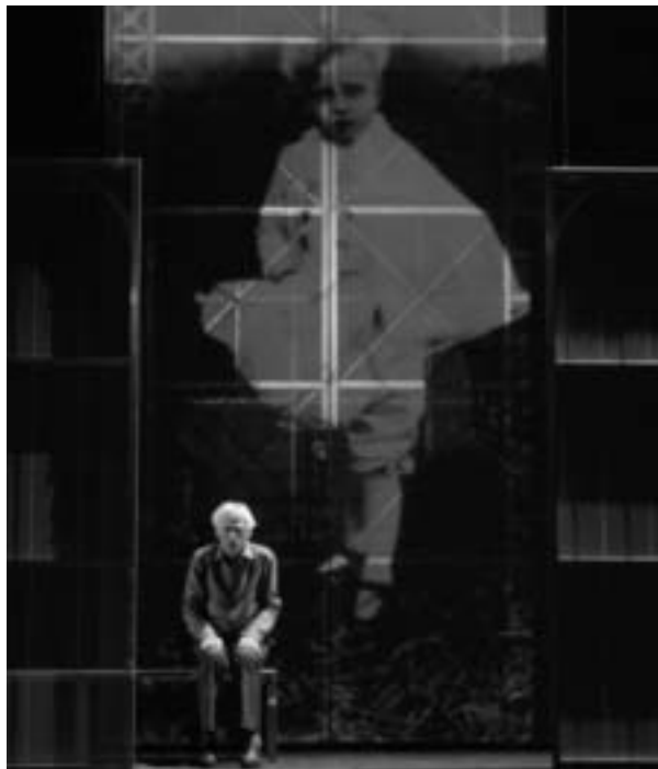
Festival d'Aix-en-Provence 2011

PARTENAIRES DES REPRÉSENTATIONS D'AUSTERLITZ À L'OPÉRA DE LILLE