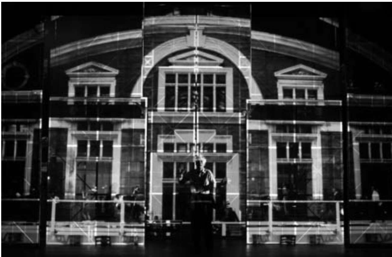
AUSTERLITZ JÉRÔME COMBIER Festival d'Aix-en-Provence 2011