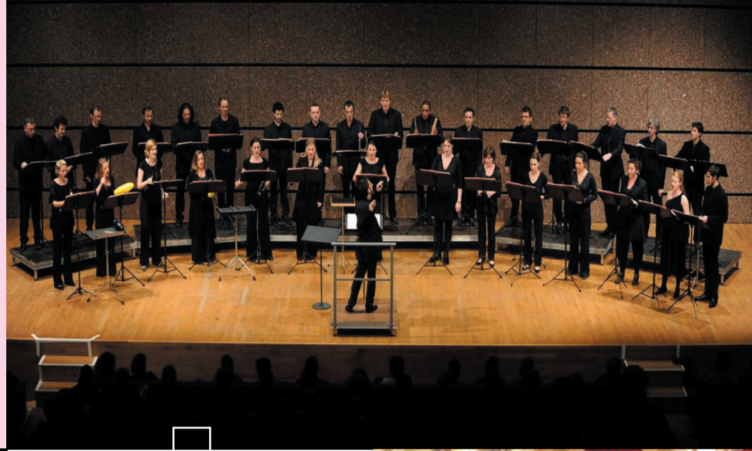
Les Cris de Paris