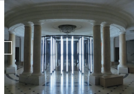
La Rotonde

Exposition LES CORNERS Petits salons de l'Opéra les soirs de représentations