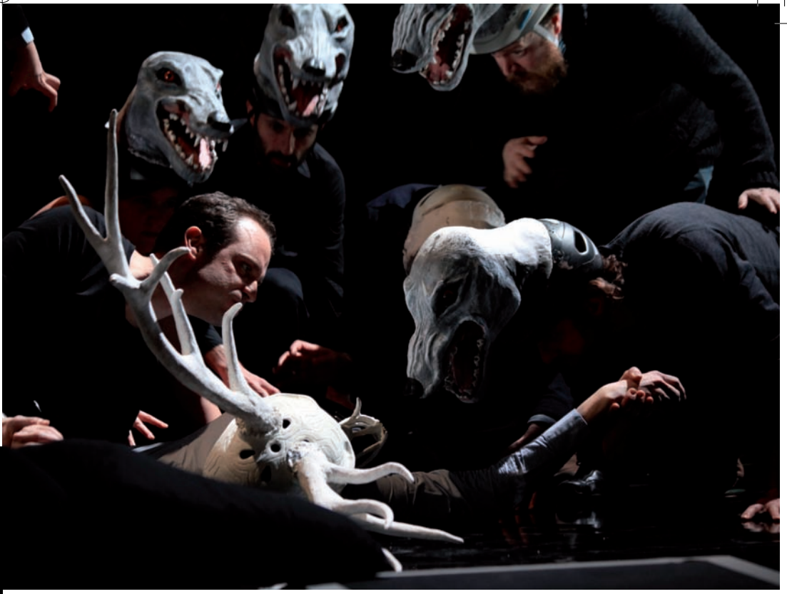
Répétition d'Actéon - Opéra de Dijon