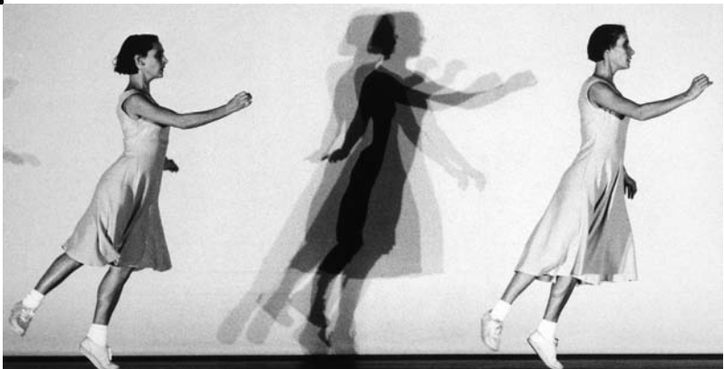
Rosas danst Rosas © Herman Sorgeloos