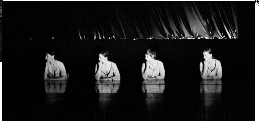
Bartók © Herman Sorgeloos